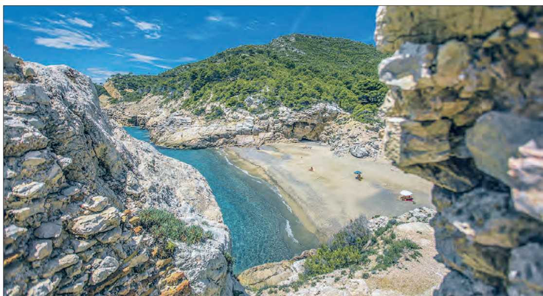
La platja naturista del Torn és una de les més fotografiades de la Costa Daurada.

Els que prefereixen alternatives d'oci més lligades a l'esport tenen al seu abast una oferta d'activitats nàutiques com caiacs, paddle surf, vela, snorkel, etc. A més, cada estiu s'habiliten unes rutes submarines que es poden fer per lliure i que permeten apreciar la riquesa biològica del fons marí. I molt a prop de les platges, es poden recórrer un bon nombre de