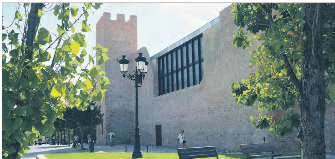
L'Hospital del Coll de Balaguer va ser fundat el 1344.