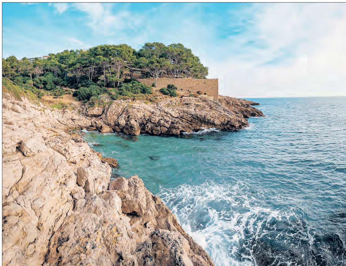
Mirador de la Cala Morisca.

18. Mirador de els Trinxeres*. Punt de visió estratègica sobre el litoral de la Costa Daurada.