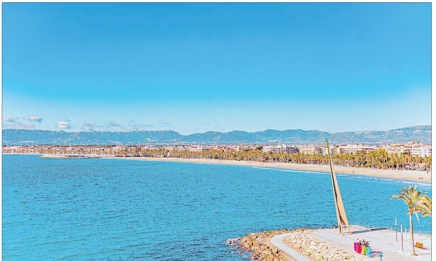
Mirador de la Torre Nova.

7. Mirador de la Platja Llarga. Bosc mediterrani, platja i mar... Tot al mateix lloc.