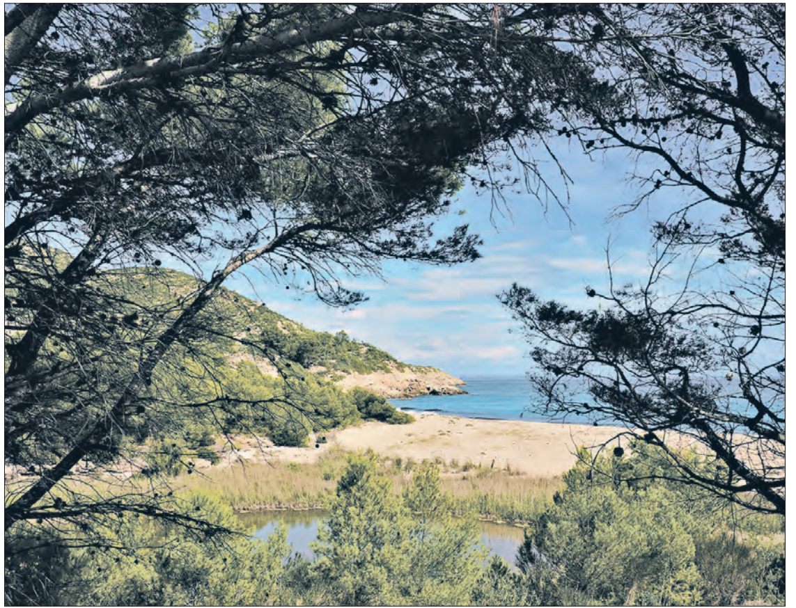
La Cala Justell és una platja recòndita que destaca per l'entorn natural verge.

Per als que prefereixin petites cales recòndites, n'hi ha tres que destaquen pel seu entorn natural verge: la Cala Justell, la Cala Bea i la Cala de la cova del Llop Marí.