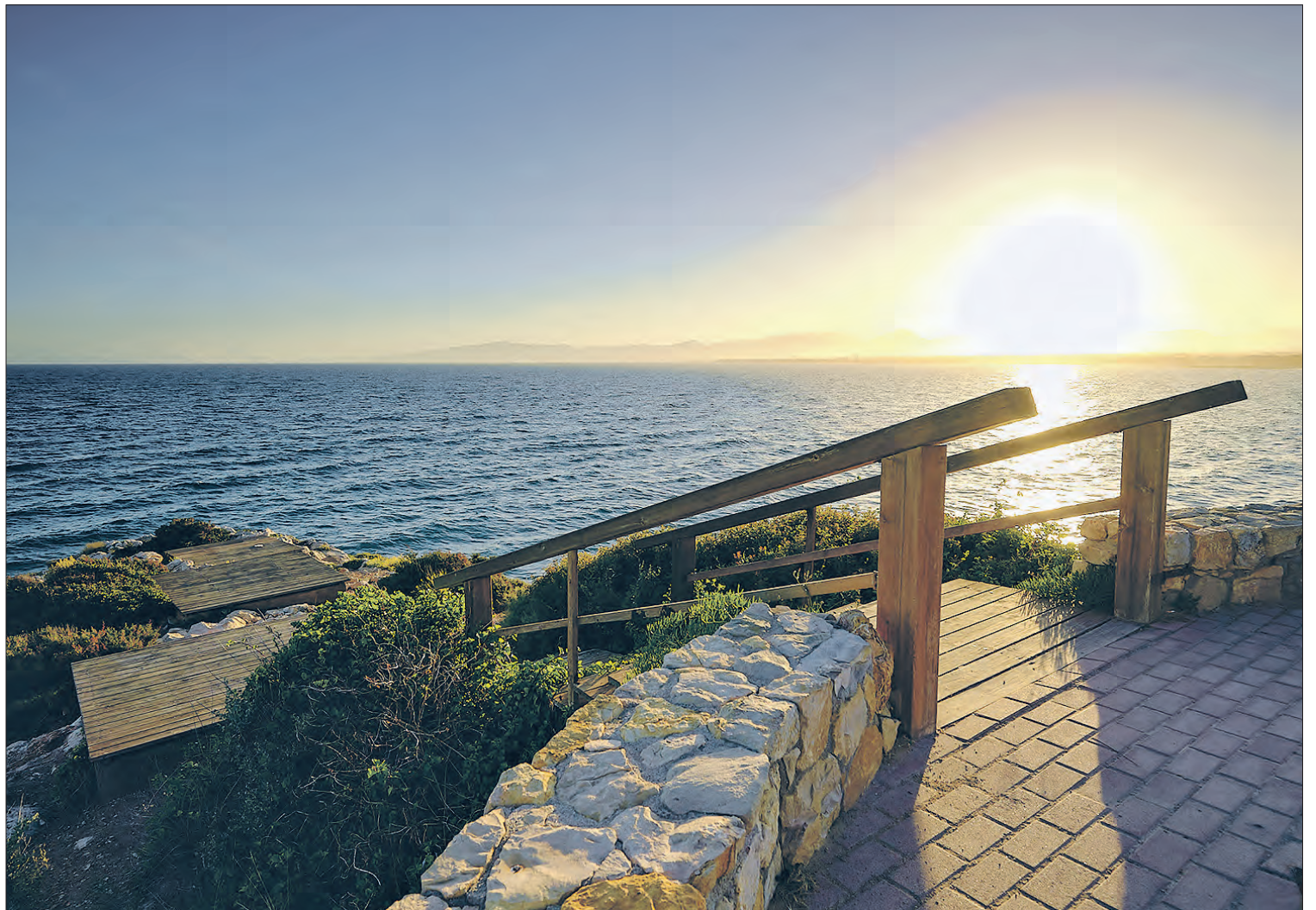
Mirador del Po-Roig.

AL MIRADOR DE LA PUNTA DEL CAVALL GAUDIRÀS D'UNA BELLA POSTA DE SOL