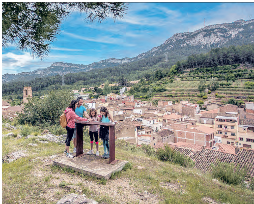
A l'esquerra, pràctica de paddle surf a la platja. A la dreta, el poble de Vandellòs.

M ar i muntanya. Els que trien l'Hospitalet de l'Infant i la Vall de Llors com a destinació turística no han d'enfrontar-se al dilema d'escollir entre el mar i la muntanya, perquè aquest lloc fusiona els dos elements. Destaca per les seves platges tranquil·les, d'aigües transparents i poca profunditat, ideals per a les famílies, i per un paisatge ric en contrastos.